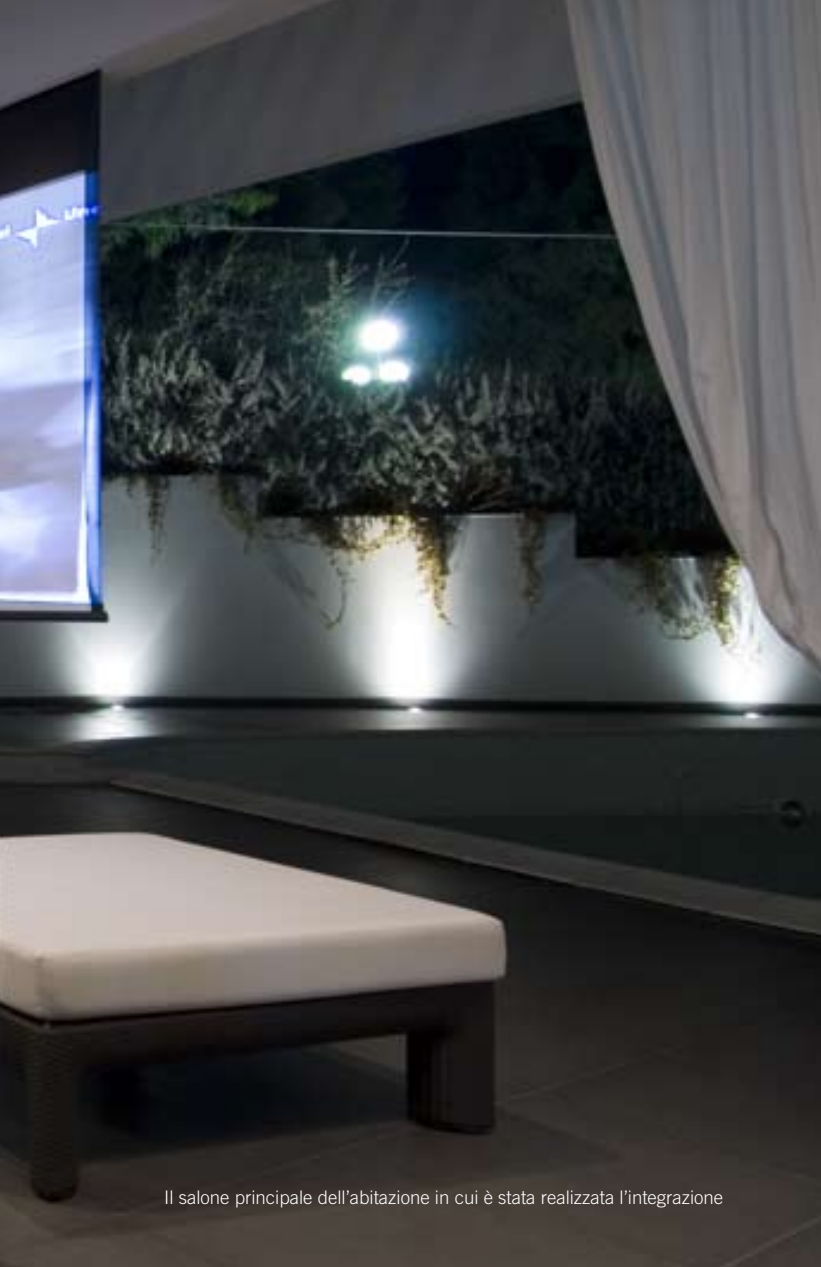
Il salone principale dell'abitazione in cui è stata realizzata l'integrazione