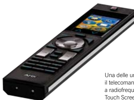
Una delle unità di controllo utilizzate, il telecomando R4: telecomando a radiofrequenza ZigBee dotato di Touch Screen da 2.4"

Lo scopo del presente articolo è quello di presentare un caso reale di applicazione che vede il sistema KNX gestire il sistema di entertainment attraverso l'utilizzo di un sistema di supervisione e controllo in grado di interagire con i diversi apparati audio video e con il bus KNX. Per descrivere il caso reale e le problematiche di gestione e controllo che possono essere superate utilizzando un sistema di supervisione e controllo con un impianto domotico KNX, prendiamo in esame una integrazione di sistema realizzata in una villa in Calabria in provincia di Cosenza. Nella fase progettuale si sono dovute considerare le esigenze del cliente che richiedeva un impianto di alto livello, in grado di adattarsi alle notevoli dimensioni della residenza, sviluppata su tre piani di circa 200 metri quadrati ciascuno e circondata da una zona giardino di circa 1.000 metri quadrati. Per espressa richiesta del cliente è stata richiesta l'integrazione della gestione luce e motorizzazioni, dell'impianto video-citofonico, e inoltre di video-sorveglianza, anti-intrusione, irrigazione giardino, ricircolo e riscaldamento della piscina, sauna e vasca idromassaggio, climatizzazione e impianti audio/video (multiroom, home theatre). Tutte queste funzioni dovevano essere fruibili da opportuni punti di comando evoluti ma anche da remoto tramite internet, consentendo anche la modifica a piacere degli scenari e delle programmazioni orarie.